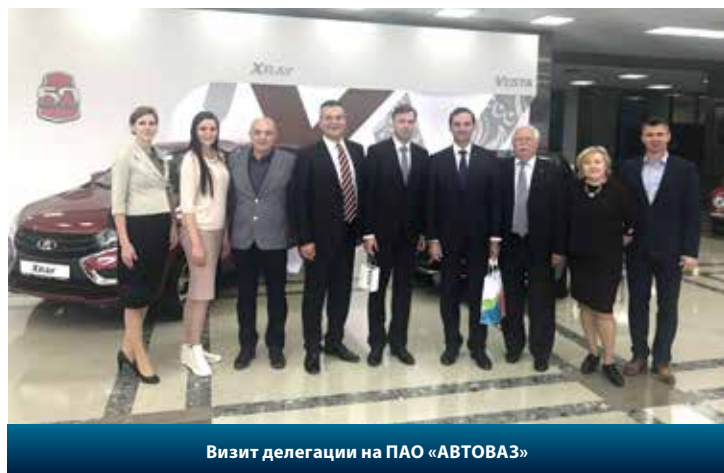
Визит делегации на ПАО «АВТОВАЗ»

спективы совместного сотрудничества в сфере экономики, туризма, образования, а также подтвердили намерение развивать отношения в области культуры и спорта. Встреча прошла в теплой и дружеской обстановке, завершилась традиционным коллективным снимком и обменом сувенирами.