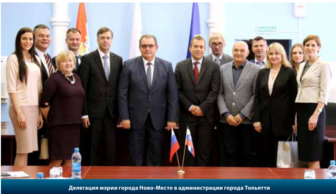
Делегация мэрии города Ново-Место в администрации города Тольятти