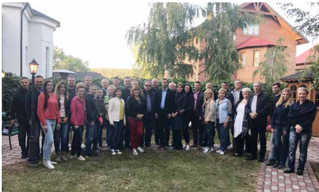
Встреча с членами НП «Русско-Словенский клуб предпринимателей»

Во время водной прогулки на катере гости получили возможность насладиться красотой Куйбышевского водохранилища, Жигулевских гор, национального парка