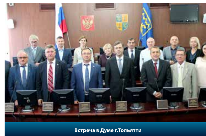
Встреча в Думе г. Тольятти