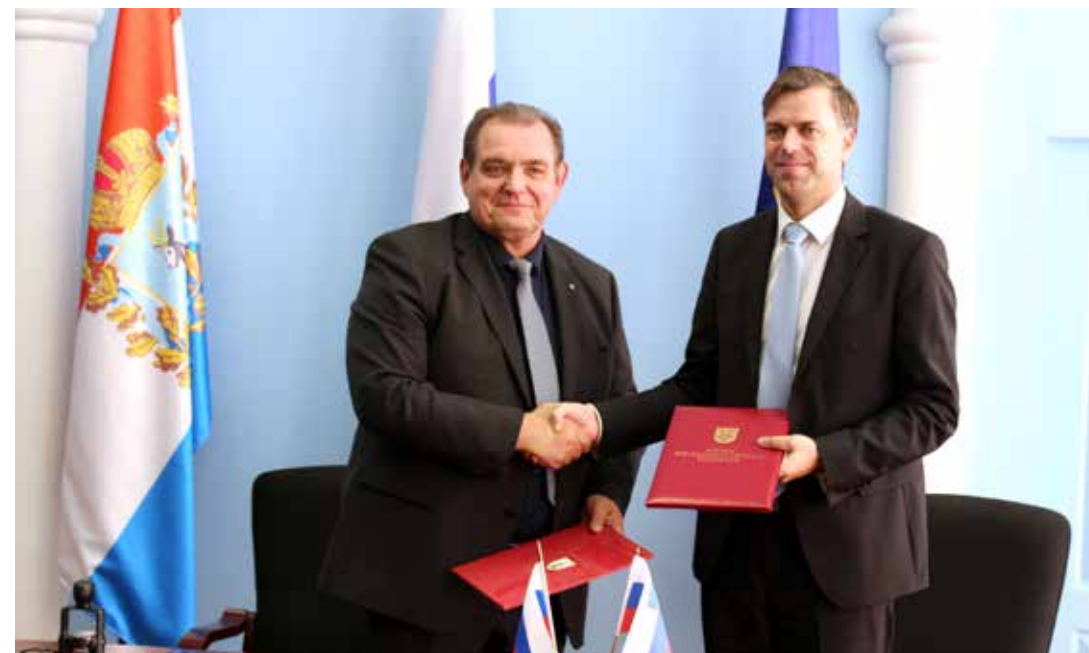
Подписание Соглашения о дружбе и сотрудничестве между г. Тольятти и г. Ново-Место

Программа пребывания делегации была подготовлена на самом высоком уровне благодаря усилиям управления международных и межрегиональных связей администрации г. Тольятти, традиционно оказавших словенским гостям очень радушный прием.