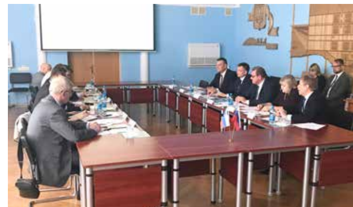
Встреча в администрации г. Тольятти

Так, 16 марта 2016 года Посол России в Словении Д.Г. Завгаев по договоренности с мэром г. Ново-Место Г. Мацедони посетил этот - один из наиболее развитых в Словении промышленных и туристических центров. В мэрии состоялся заинтересованный обмен мнениями о возможностях и путях наращивания двустороннего сотрудничества в области экономики, культуры, образования, науки и туризма. Мэр Г. Мацедони выразил заинтересованность в установлении партнерских отношений с г. Тольятти и подписании с ним Соглашения о дружбе и сотрудничестве на основе документа, который был ранее передан российской стороной бывшему градоначальнику г. Ново-Место.