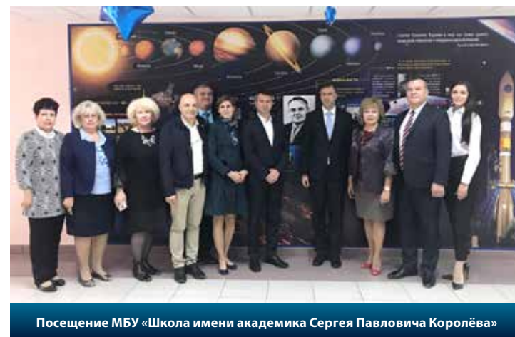
Посещение МБУ «Школа имени академика Сергея Павловича Королёва»

выразило свою готовность оказать словенским компаниям содействие по организации предприятий на территории г.о. Тольятти с целью дальнейшего получения статуса резидента «Жигулевской долины».